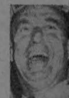
FIGURA DEL MOMENTO

Adlai Stevenson, designado por el Partido Demócrata de los Estados Unidos como su candidato a la presidencia de la República, en las próximas elecciones presidenciales.