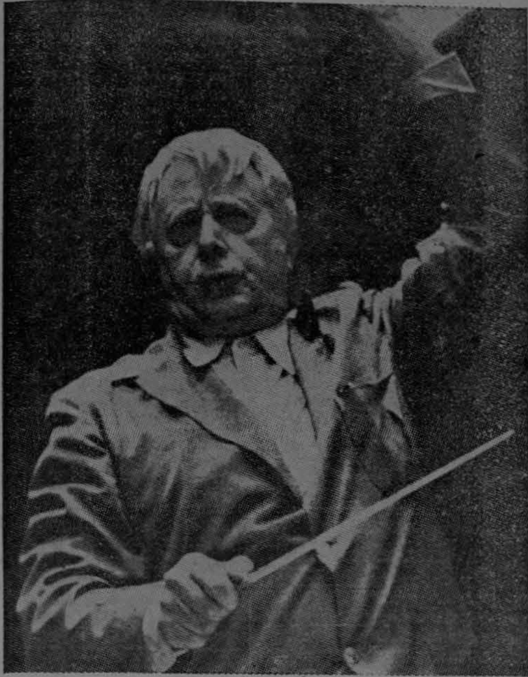
Charles Munch, durante un ensayo con la Orquesta Sinfónica de Boston, conjunto de la que es su actual director titular.

"Al llegar al vestíbulo del teatro, para el ensayo matinal, no abra directamente la puerta en que se lee el letrero que dice: "Entrada al Escenario". Deténgase por un instante y escuche los sonidos indisciplinados que surgen de la sala de músicos. Los violinitas están afinando, ejecutando escalas o pasajes de conciertos. Quienes se encargan de los instrumentos de viento trabajan también arduamente para ponerlos a tono. Son como atletas diseminados en un estadio, que tratan de entrar en calor antes del comienzo de un torneo. Este clima de anarquía musical es tan estimulante para un director de orquesta como el fresco olor de la tinta de imprenta para un periodista o el aroma de un buen vino para un catador".