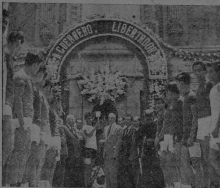
Ante el Monumento a la Independencia se efectuó en la capital de la República el homenaje a la memoria del libertador don Vicente Guerrero, acto en el que destacó la presencia de la juventud deportiva de la ciudad que acudió en gran número a testimoniar su admiración a uno de los fundadores de la nacionalidad mexicana.